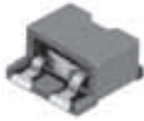
(0.15μH - 8.8μH)